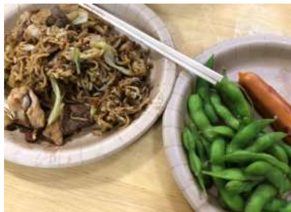
完成！肉・野菜たっぷり！

「夏も終わりに差し掛かり」そうである、中々涼しくならない9月14日(水)、お手軽料理が学べて、楽しく食事也能する、生活講座「ゆいのエプロン」が行われました。第2回目の今回は「懐かしい夏祭り風メニュー☆」ということで、焼きそばや枝豆を作りました。