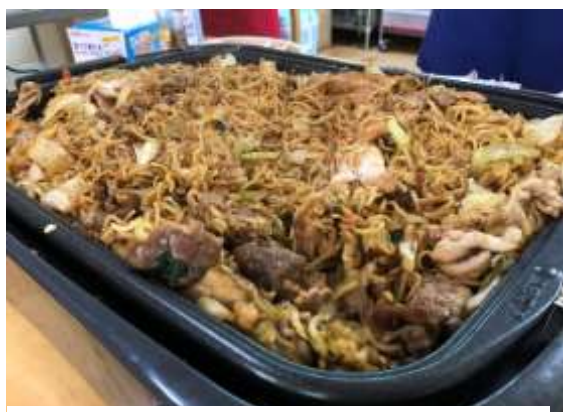
すっかりソース色