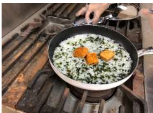
チゲスープの素投入

アルファ米はすでに味が付いているので簡単にいろいろなアレンジができ、参加者で楽しむことが出来ました。