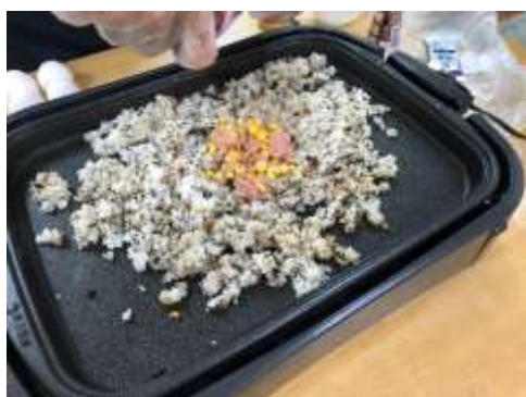
ひじきご飯と具材を炒めます