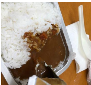
ビーフがごろごろです

賞味期限が近い防災備蓄用カレーライスの提供をいただきました。発熱剤入りで、火を使わず温かい食事ができます。発熱剤を化学反応させると勢いよく泡や水蒸気が噴き出し、30分で完成します。